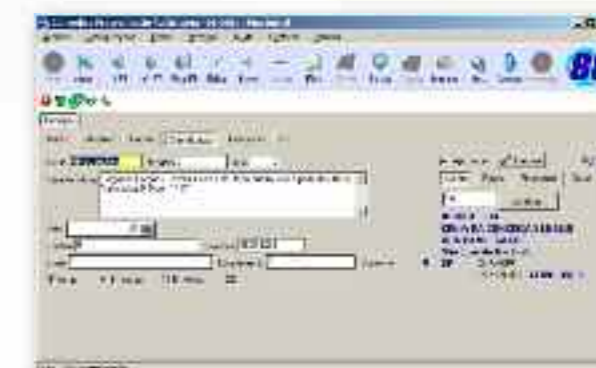
Exemplo de entrada de Classificados