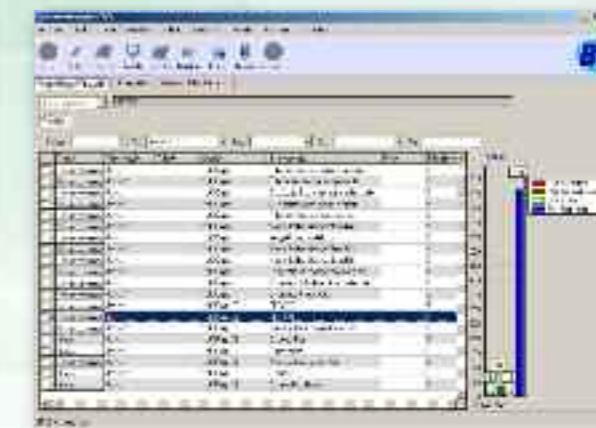
Seleção de matérias no Módulo Editorial