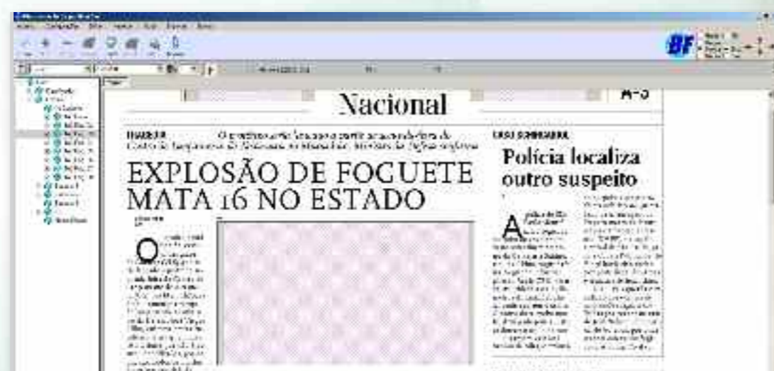
Tela da Diagramação exibindo as seções e uma visualização de uma página em andamento

Após a captação das informações, elas serão associadas a um layout gráfico e seus textos e fotos atualizados para seguir esse layout. Durante este processo de adequação, o AICS permite um controle