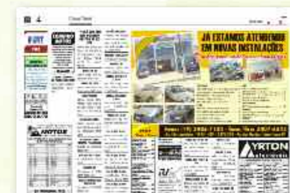
Exemplo de Montagem automática de páginas